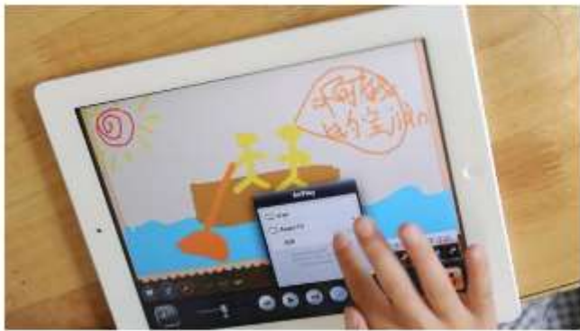
Experten fordern ICT ab 1. Primar

Laut ETH-Professoren droht der Schweiz eine Bildungskatastrophe, falls im Lehrplan 21 (LP 21) der Informatikunterricht nicht ab der ersten Klasse eingeführt wird. Programmieren sie heute genauso wichtig wie Lesen, Schreiben und Rechnen. In den bestehenden Entwürfen des LP 21 wird "ICT und Medien" als überfachliche Kompetenz ohne festen Platz in der Stundentafel aufgeführt.